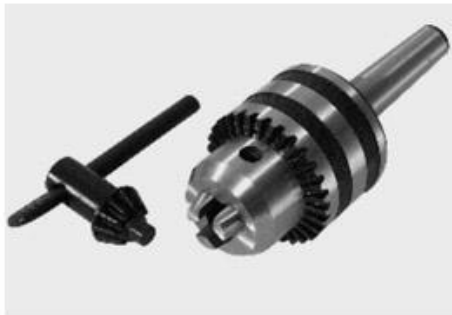
13mm尾坐钻夹头带锥柄