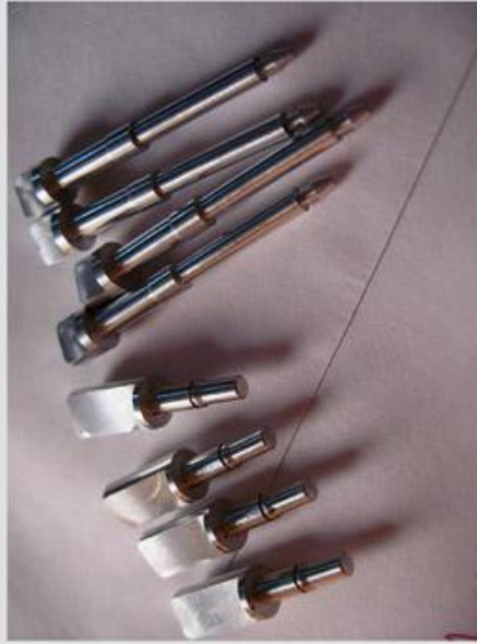
职业院校数控培加工作品