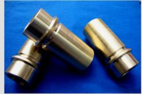
创客爱好者加工作品