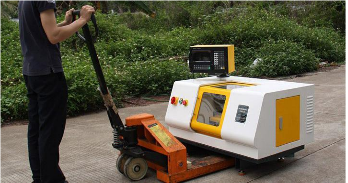
CK210 小型数控车床图片